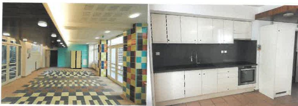
La salle de convivialité : accueil des bénéficiaires, espace de vente pour les produits hors denrées alimentaires, ateliers.

normes » réhabilitée en 2007 et fermée depuis janvier 2017), matériel en état de marche (armoires frigorifiques), ancien réfectoire pouvant accueillir les denrées alimentaires à la vente, salle adjacente pour l'accueil des bénéficiaires et la vente des autres produits.