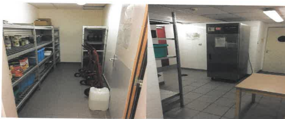
Aperçu des locaux et du matériel dédiés au stockage (ancienne cuisine).