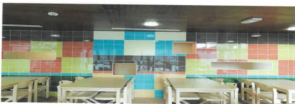
L'ancien réfectoire, espace de vente pour les denrées alimentaires.