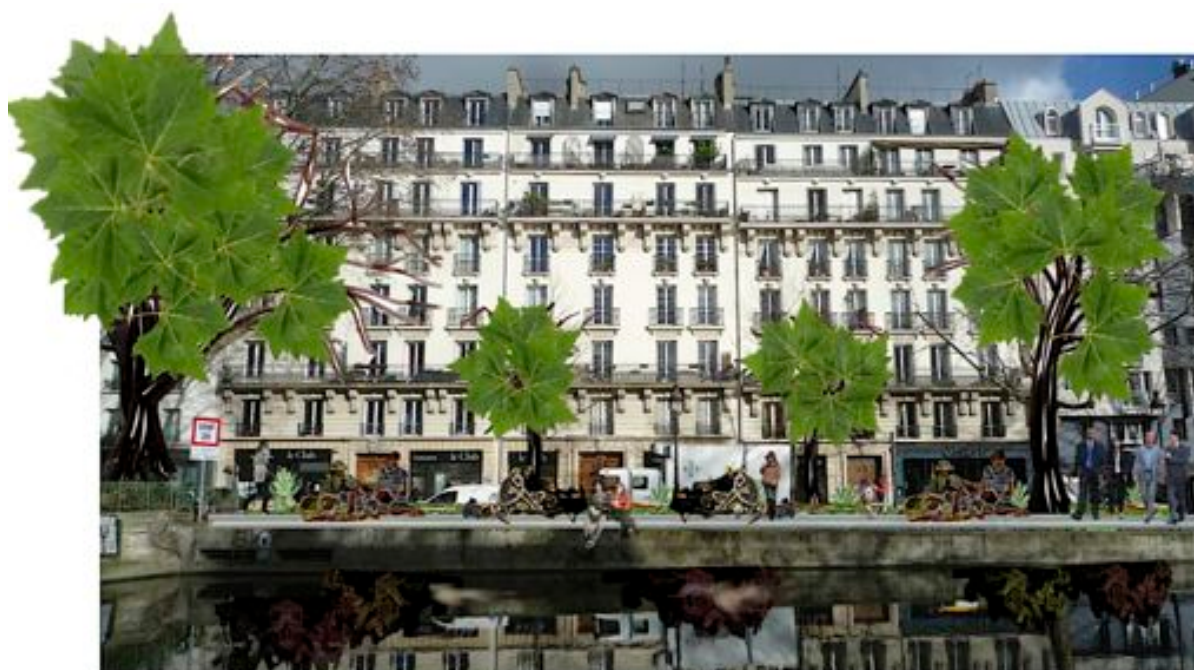
Projet « Sous les Pavés la Terre » Budget Participatif Mairie de Paris 2018