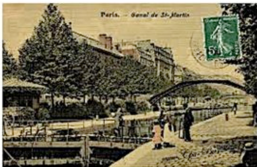
Photo archive Canal St Martin Frise Arbustive entre les Arbres d'Alignement