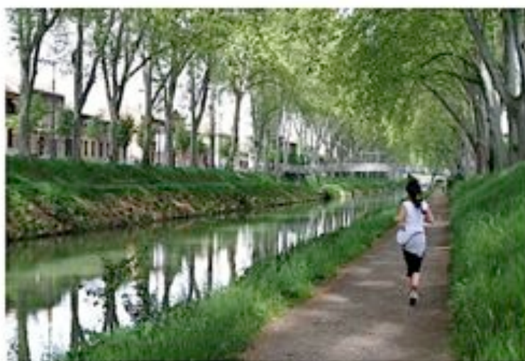
Image de référence Canal de Brienne Projet « Sous les Pavés la Terre »

Le Projet attire l'attention sur la pollution, et de la nécessité d'une ' dés-imperméabilisation des sols ' ; en remplaçant les pavés par des surfaces terreuses pourvues de noues, en valorisant l'ambiance champêtre 'Nature en Ville' dans sa biodiversité, et se présente comme un élément de réponse au Plan Climat de la Mairie de Paris et de la Marie du 10 e .