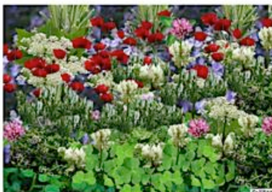
Projet Palette Végétale Module entre les Platanes

'Le Budget Participatif est une belle opportunité pour améliorer la vie des Citadins.'