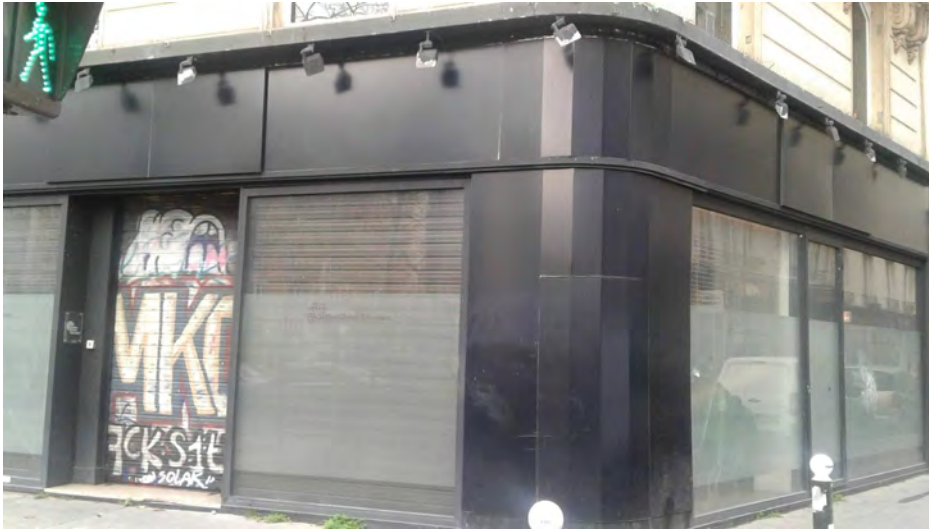
Boulevard Voltaire, 75011