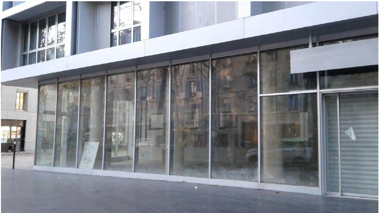
Boulevard Diderot (ancienne caserne de Reuilly)