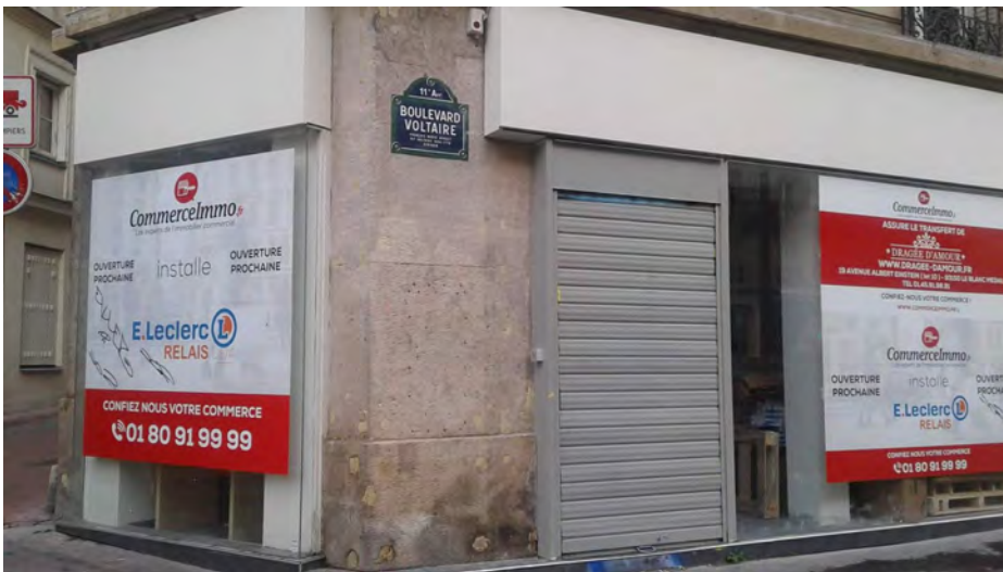
Boulevard Voltaire, 75011