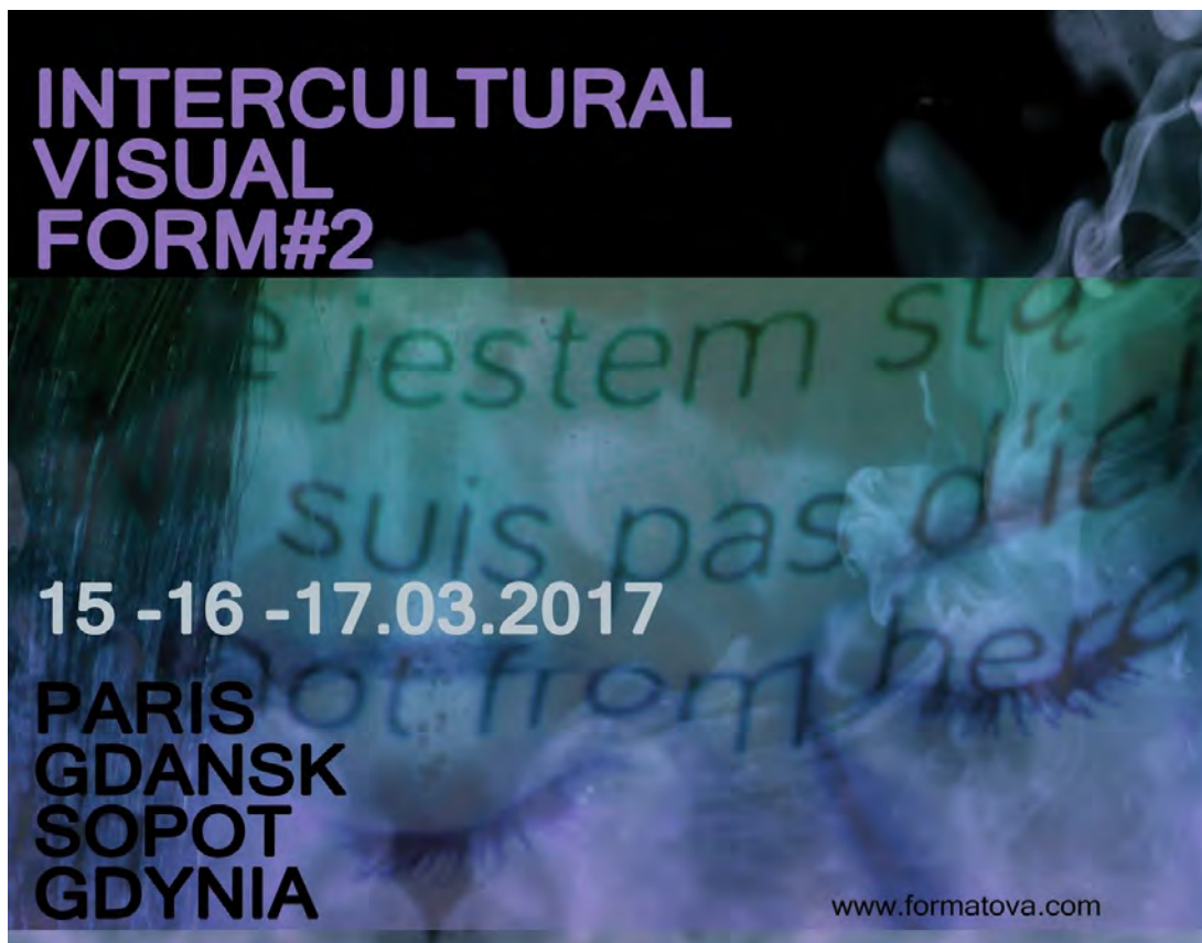
Flyer Intercultural Visual Form#2 2017

Nous pouvons témoigner par le biais de nos actions réalisées sur la qualité en programmation et sélection artistique.