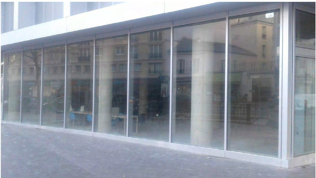
Boulevard Diderot (ancienne caserne de Reuilly)

Notre projet est prêt pour être lancé, appuyé par son équipe interculturelle de professionnels (métiers de la culture) , son savoir faire (gestion projet), et sa stratégie (communication, partenariat). Le soutien de La Ville de Paris nous permettra de poursuivre les étapes en confiance et professionnalisme.