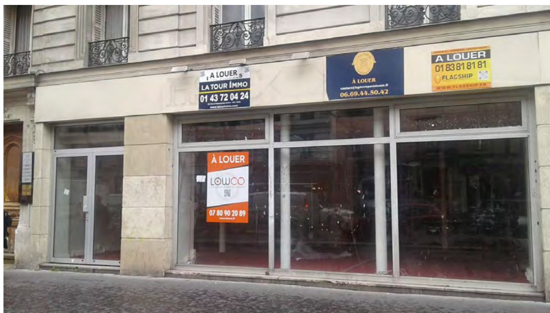
Boulevard Voltaire, 75011

Nous avons documenté quelques espaces vides qui peuvent servir comme des vitrines artistiques éphémères :