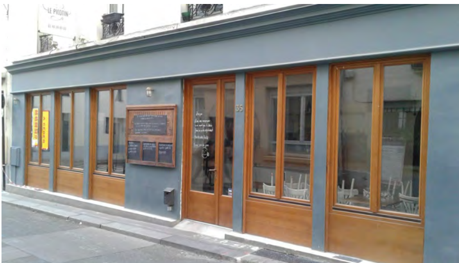
Rue Sibuet, 75012

Dans le 12ème, il y a un espace vitré, qui puisse être un exemple parfait, l'ancienne caserne de Reuilly, qui donne sur le boulevard Diderot. Espace grand, spacieux, visible d'extérieur, la rue est très fréquentée. Chaque fois qu'on passe, on aimera voir des artistes ou des œuvres dans ces bel vitres vides depuis plus d'un an :